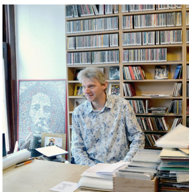
KOZMIC MUSIC à Bruxelles