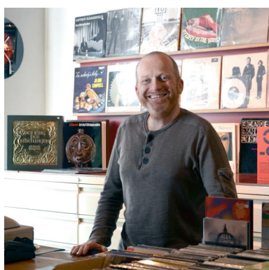
HORS-SÉRIE à Bruxelles