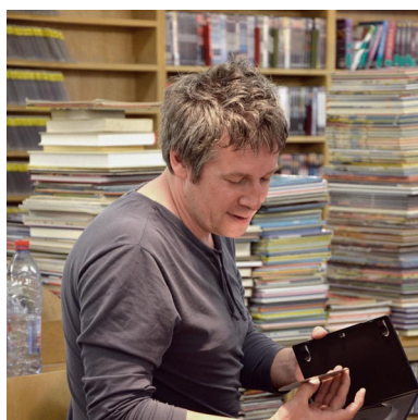
PÊLE-MÊLE IXELLES à Bruxelles