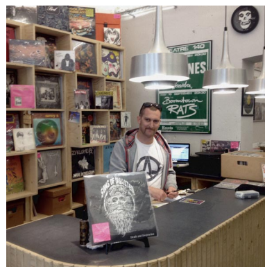
72 RECORDS à Bruxelles