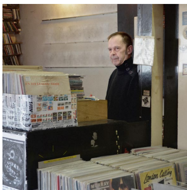
CARNABY RECORDS à Liège