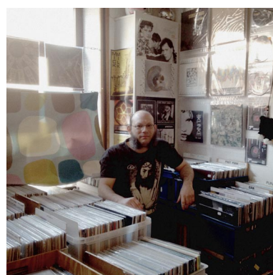
WOOL E-SHOP à Gand