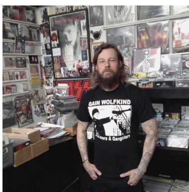
ELEKTROCUTION à Bruxelles